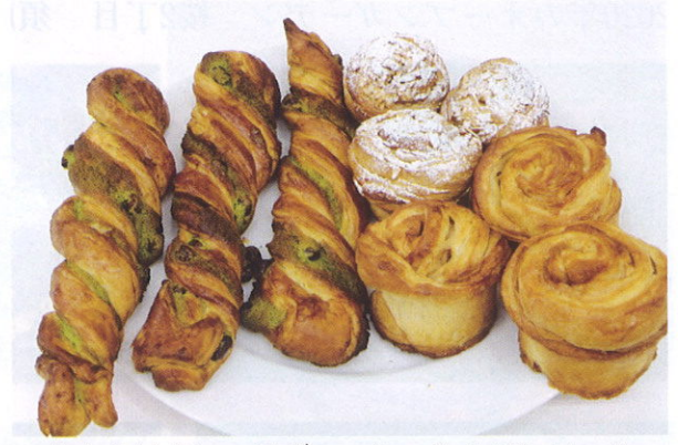
サクリスタン・テヴェール シナモンロール 須藤公子 (桜)