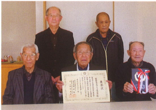
表彰を喜ぶ、老人クラブ連合会役員の皆さん