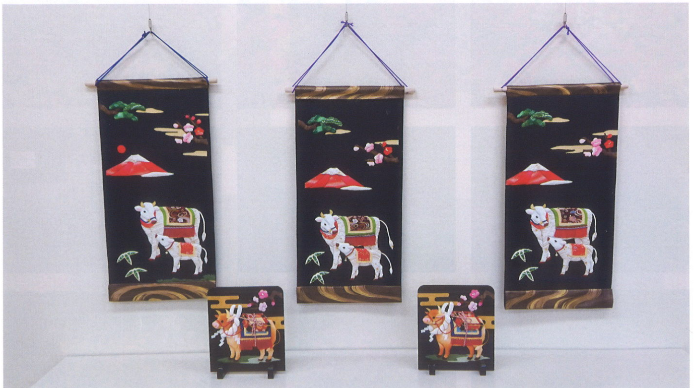
丑のタペストリーとつい立て なかよしクラブ (大久保・松本・増淵・市川・宮嶋)