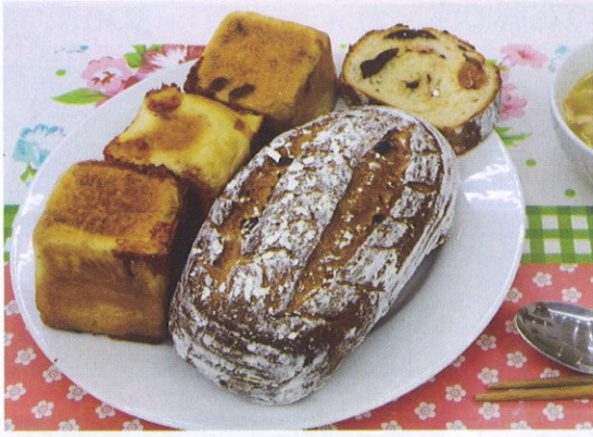
キューブのチーズパン カンパーニュ 須藤公子 (桜)