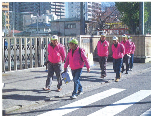
12月3日(日) 第2回桜クリーンデー 64名参加