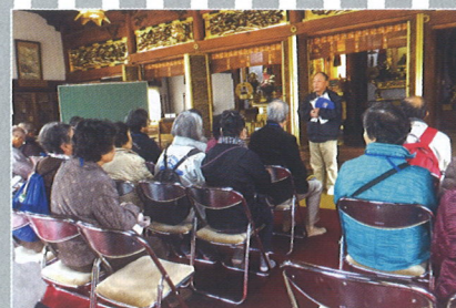
←地域まちあるき講座