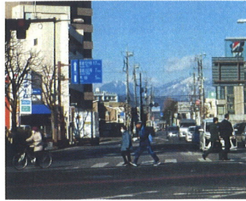
桜2丁目交差点 (師団長官舎前)

明治維新後、県庁を栃木から移す際莫大な寄付を集めました。産業が無いのは、街に活気が出ません。そこで日露戦争中14師団を、また多額の寄付金を集め、土地を買い建物を造りライフラインを完