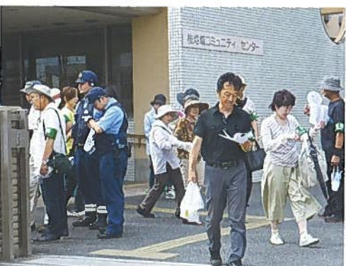
7月4日(水) 子どものための市民総ぐるみ環境点検活動 78名 青少年育成会