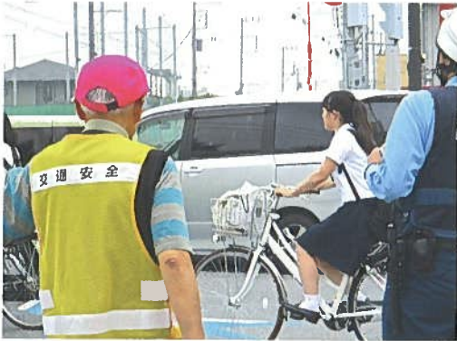
6月8日(金) 毎月8の日の運動 交通安全推進協議会