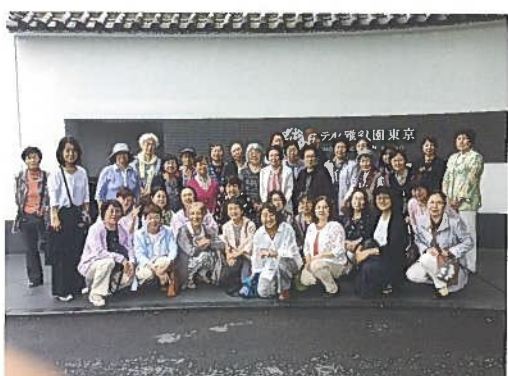
6月21日(木) 研修旅行 38名 婦人防火クラブ