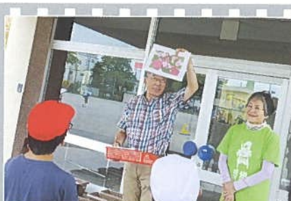
花いっぱい運動関連事業 「桜小の栽培委員会の児童とコスモスの種を蒔こう」 を7月5日の委員会活動の時間に行いました。