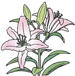
←第2回 健康手芸 キーホルダーを作ろう

たいへんご足労をおかけしますが、桜地域コミュニティセンター(桜小学校教育地内東側)(TEL63612007・日曜と月曜・祝日休み)までお出でくださるようお願いいたします。