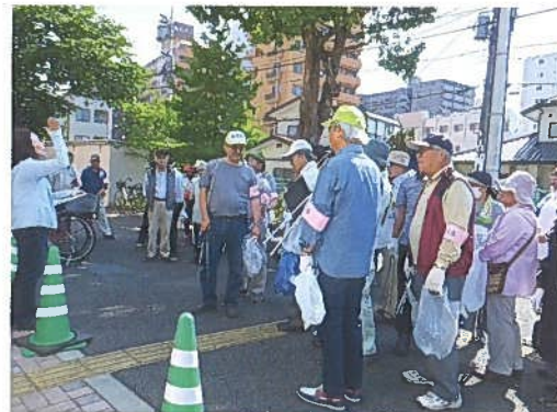
6月3日(日) さくらクリーンデー 63名 環境部会