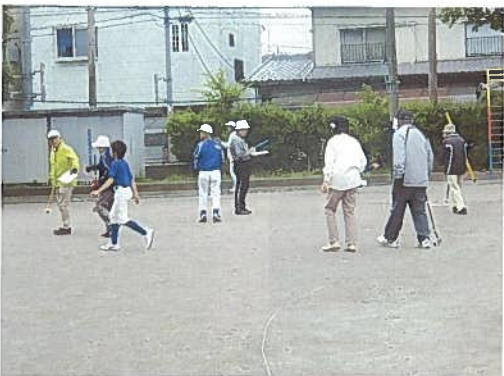
6月16日(土) グラウンドゴルフ大会 31名 体育協会