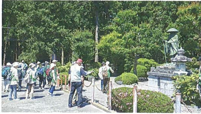
5月20日(日) ハイキング 栃木市大神神社〜下野市 風土記の丘公園 39名 体育協会