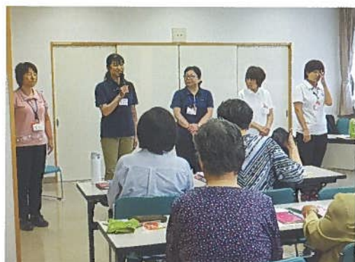
6月14日(木) 認知症サポーター養成講座 34名 女性の会