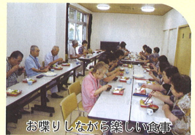
お喋りしながら楽しい食事