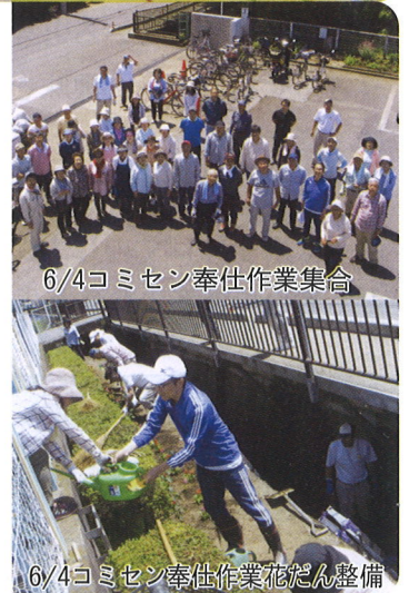
6/4コミセン奉仕作業集合