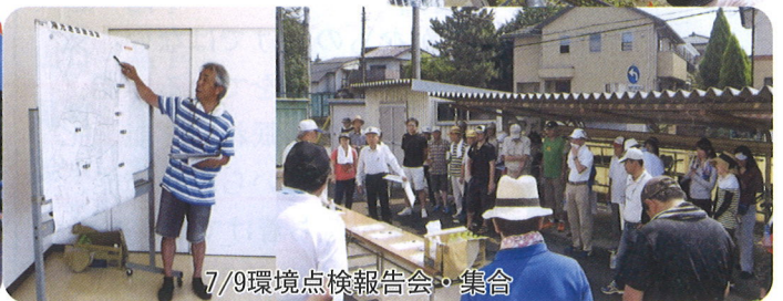
7/9環境点検報告会・集合