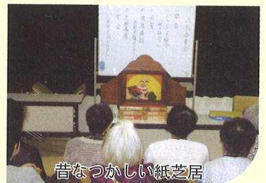
昔なつかしい紙芝居