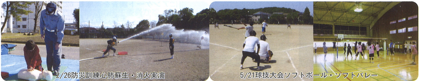
2/26防災訓練心肺蘇生・消火実演

編集・発行 陽光地区まちづくり推進協議会 広報部会 宇都宮市緑5-8-8 電話・FAX 028-658-3373