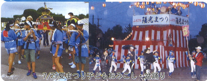
7/29夏まつり子どもおみこし・盆踊り