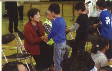
見守りお散歩隊の皆さんに感謝