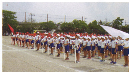
←みんなで力を合わせた運動会

地域の様々な行事を通して、多くの皆様との交流を通じた体験が、子どもたちの将来を照らす光になると確信しております。これからもどうぞよろしくお願いいたします。