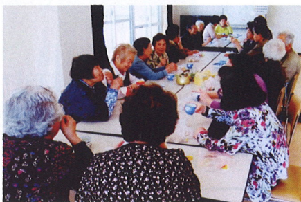
緑四丁目 緑南長寿会の皆さん