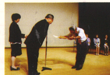
宇都宮南図書館ホールでの受賞式