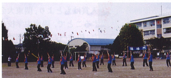
体育祭での健康づくり体操

普段の活動に加え、年一回の調理実習や旅行(去年は富士山を見に河口湖へ)、近隣へのウォーキングや会食会、体育祭への参加など健康寿命男性72歳、女性76歳と言われる昨今、最後まで自分の足で何でも出来る様にと脳の活性化に向け会員一同楽しく活動しています。