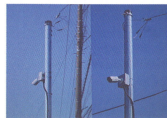
児童公園に設定された防犯カメラ

自治会内2か所の児童公園に1台ずつ取り付けて子供たちと自治会住民の安全・安心を見守っています。