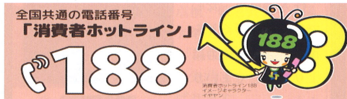
消費者庁 イラスト集より

このようなことがあったら取り合わず、すぐに局番なしの188番に電話して相談しましょう。