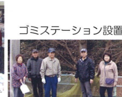
ゴミステーション設置