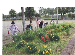
今一公園清掃活動

本年、新型コロナウイルス感染症による活動自粛が続いていますが、終息後は引き続き陽光