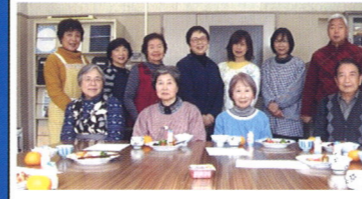
みんなで弁当を作りました

また、ごみステーションや環境問題の取り組みや災害時の自主避難訓練を実践しています。