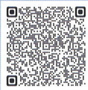
洪水ハザードマップ