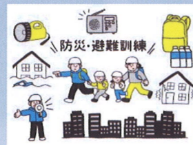
わが家の防災マニュアル