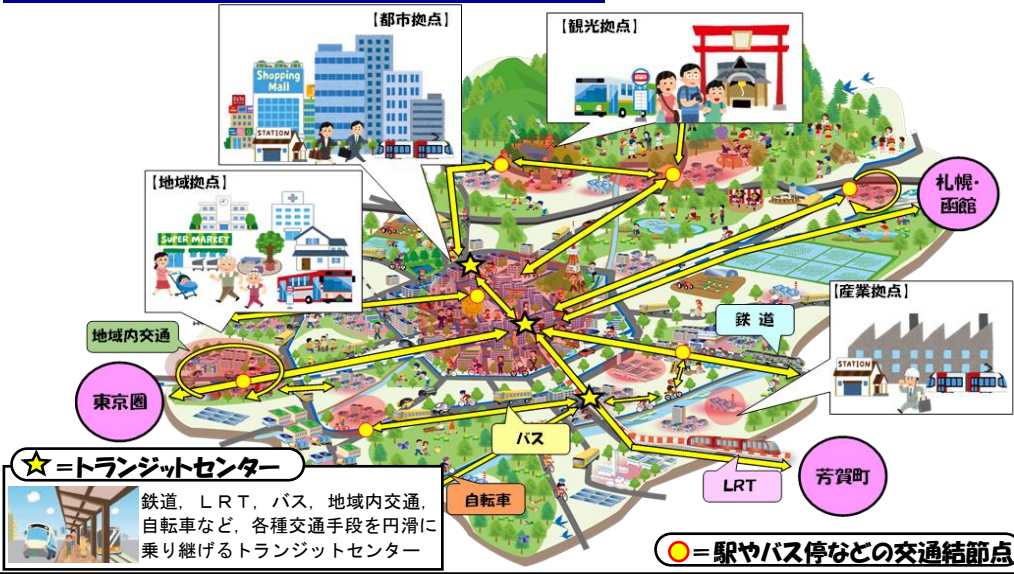
「交通未来都市 うつのみや」のイメージ化