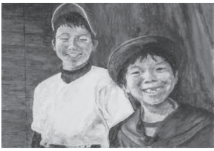
▲宇都宮市長賞受賞作品