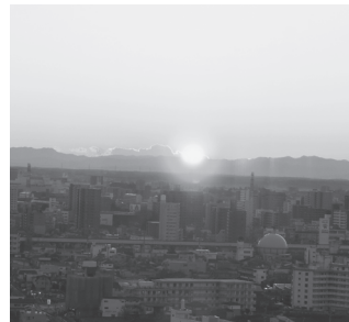
▲宇都宮タワーから見える初日の出(平成28年1月1日撮影)

▽その他 1月1日午前7時20分～10時は、宇都宮タワーに無料で入場できます。問八幡山公園管理事務所☎(624)0642