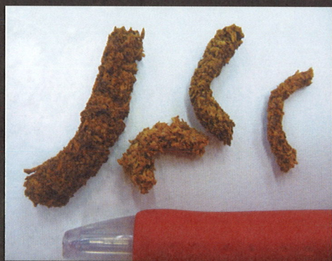
木くずと幼虫の糞が固まって かりんとう状となる