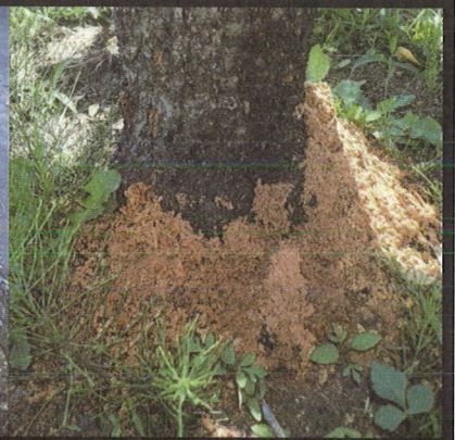
赤茶色のフラスが株元に積もったサクラ(左)とモモ(右)