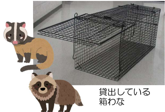
貸出している箱わな