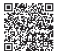
▲スマートフォン・タブレット用QRコード

◎自死遺族支援 わかちあいの会「こもれび」 ▽日時 2月4・18日(土)、午後2時〜4時 ▽会場 と ちぎ福祉プラザ(若草1丁目) ▽内容 大切な人を自死により亡くした人々の思いを分かち合う ▽対象 家族や身近な人を自死で亡くした人 ▽費用 200円。☎栃木いのちの電話事務局 ☎(622) 7970、保健予 防課 ☎(626) 1114