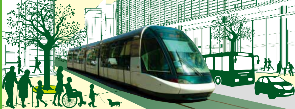
LRTの車両はイメージです(写真はストラスプール(仏)の車両)

宇都宮市は、公共交通にLRTが加わることで、バスなどの他の交通手段も便利になり、もっと活力のあるまちへと変わります。今回は、乗り換え施設(トランジットセンター)に関するご質問にお答えします。