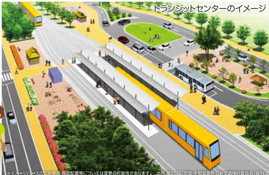
※イメージバスのため車両・施設配置等については変更の可能性があります。

A 主要な5カ所の乗り場には、乗り換え施設(トランジットセンター)を設けることで、バスや地域内交通、自動車、自転車などのさまざまな交通手段からスムーズにLRTを利用することができます。