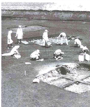
▲ 2段の造りになっている。

長岡街道から長岡最終処分場に向かう途中の田川右岸にある、県内でも有数の大型円墳です。造りは二段で、直径五十三・四メートル、高さ三・四メートルの第二段の上に、高さ二・八メートルの第一段が乗っています。一帯は雑木林で、この辺りから北に大ジノ古墳群や長岡百穴などがあり、史跡の宝庫でもあります。 「古墳の周りに幾つか四角い大きな穴がありますが、これは戦時中、軍事工場をここに移転するため工事を始めたのですが、終戦となり、残った穴です。古墳も壊されずに残りました（昭和32年8月27日、県指定史跡）。