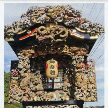
■嘉永元年(1848年) 坊村 ⑦ ■磯辺儀兵衛敬心 作 ■鬼板は浪に龍です。その下にもたくさんの龍が彫られています。正面の内障子と側面の脇障子は牡丹に獅子の彫刻で埋め尽くされています。また側面の高欄は曲線状の虹高欄です。