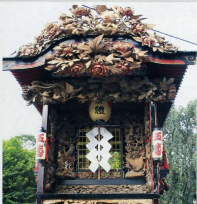
■文化6年(1809年) 岡坪 ⑤ ■後藤常吉正秀 作 ■鬼板には彫りの深い牡丹ににわとり、小鳥が彫られています。正面は牡丹の彫刻が多く見られます。側面の脇障子は松に鷹が彫られています。また障子周りは菊が彫られています。