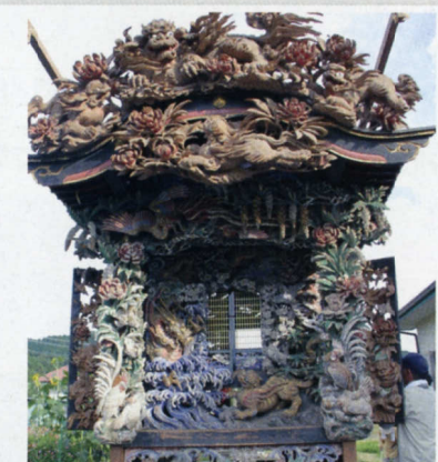
■安政元年(1854年) 仲根 ⑥ ■磯辺儀兵衛敬心 作 ■鬼板には牡丹に獅子が彫られています。正面の内障子は荒波に龍と虎の彫刻が施されています。側面の障子周りは色とりどりの菊が彫られ、柱隠しは牡丹とにわとりが彫られています。