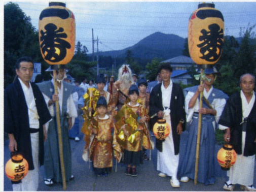
神楽獅子・猿田彦面・採物・衣装一式は宇都宮市指定文化財