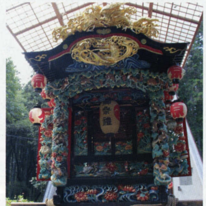
■江戸末期 原坪 ④ ■後藤周二正秀 作 ■鬼板には金色の浪に龍が彫られています。脇障子と障子回りは菊で埋め尽くされ柱隠しと梁にはぶどうとリスが彫られています。また、後面には火炎の龍と虎が彫られています。