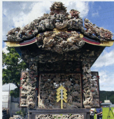
■文政11年(1828年) 六本木 ③ ■高田伊兵衛 作 ■鬼板には親獅子が子獅子を谷底に蹴落とす様子が彫られています。正面の内障子や側面の脇障子の彫り物は菊とにわとりが組み合わされ、柱隠しには金色の瓢箪とリス、白ねずみが彫られています。