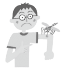
蚊やノミなどに刺される