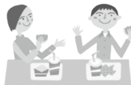
食器や箸を共用したり 同じ皿の料理を食べる