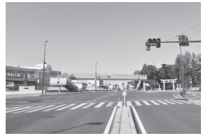
▲まちなみ景観賞 作新学院前交差点周辺のまちなみ