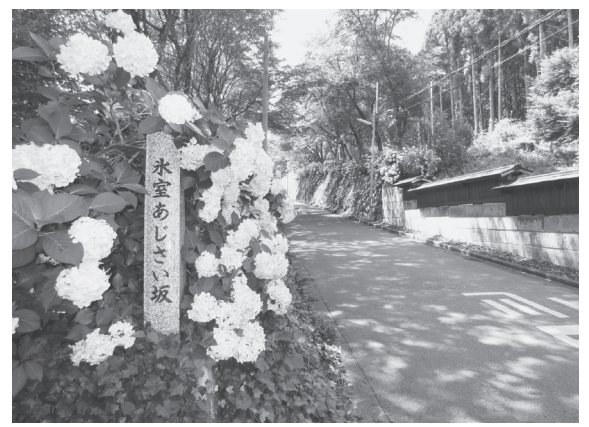
▲まちなみ景観賞大賞 氷室あじさい坂