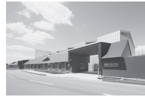
▲まちなみ景観賞 君岡鉄工宇都宮工場