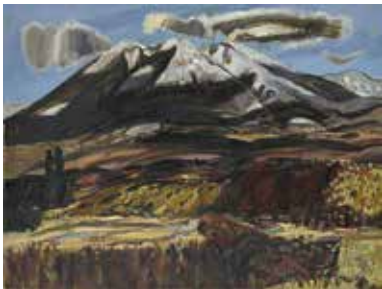
灰野文一郎「冬の那須山」1961年 個人蔵