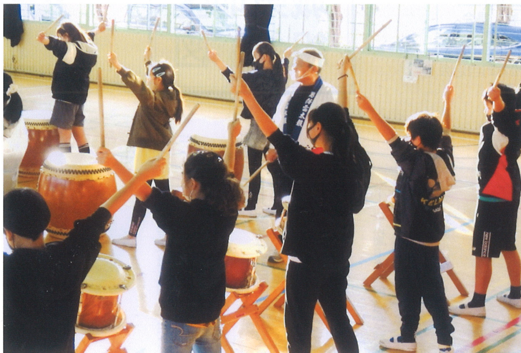
ふれあい文化教室 6年生太鼓の体験