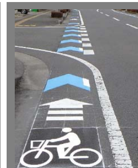
矢羽根型路面表示