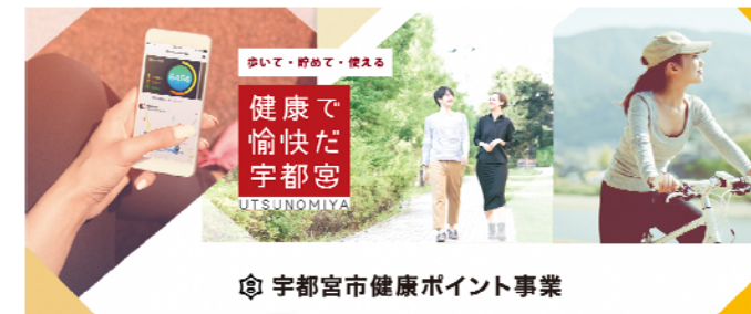
宇都宮市健康ポイント事業

「歩く」「自転車に乗る」といった運動や健診の受診など、健康づくりに取り組むとポイントが貯まり、貯まったポイントでサービスや特典が受けられます。