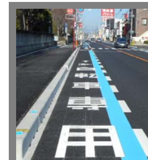
自転車専用通行帯