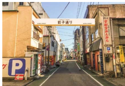
市道886号線(宮島町通り)整備