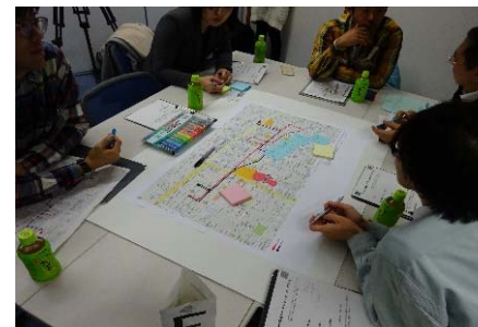
民間主体による低・未利用地等の有効活用の促進