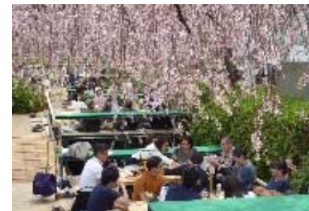
親水空間を活用した賑わい創出事業の実施・拡充(釜川周辺地区)