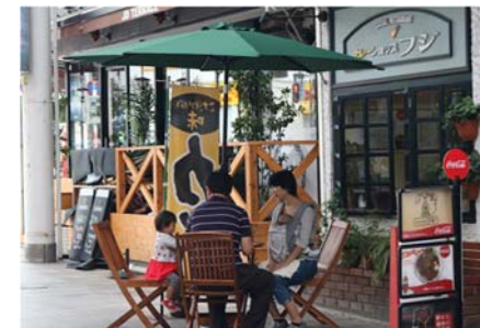
オープンカフェの実施(オリオン通り)