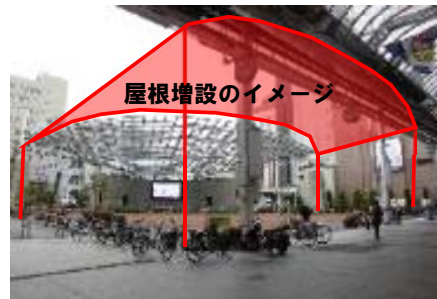
オリオン市民広場機能向上事業