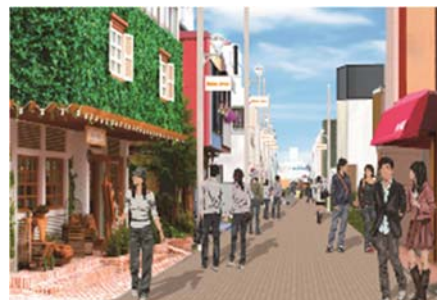
市道3号線(ユニオン通り)整備