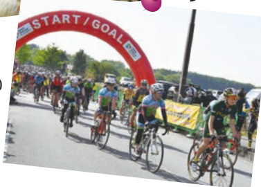
4月30日 うつのみや サイクリングピクニック