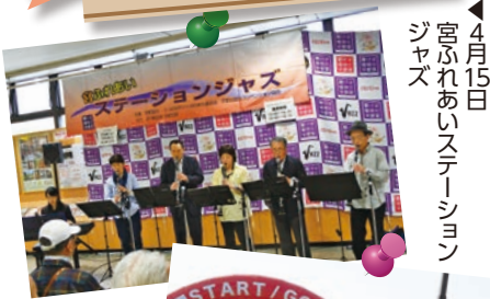
4月15日 宮ふれあいステーション ジャズ