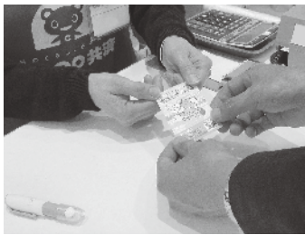
▲ポイントをもらう様子