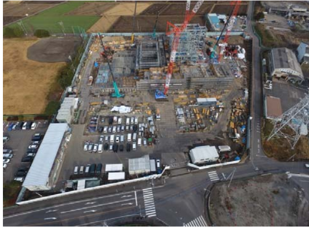
航空写真(建設地全体)