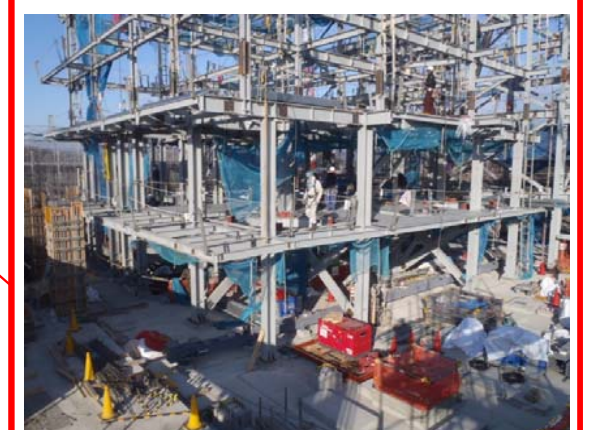
炉室・発電エリア(ごみ焼却棟)