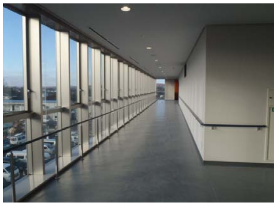
見学者通路(ごみ焼却棟)