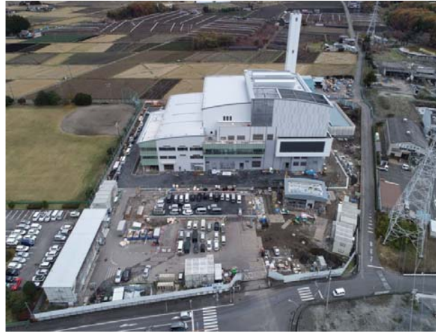
航空写真(建設地全体)