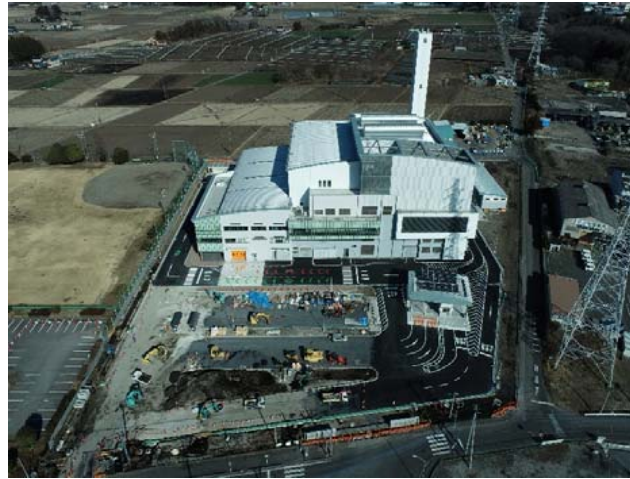
航空写真(建設地全体)