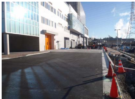
舗装工事を行っております。