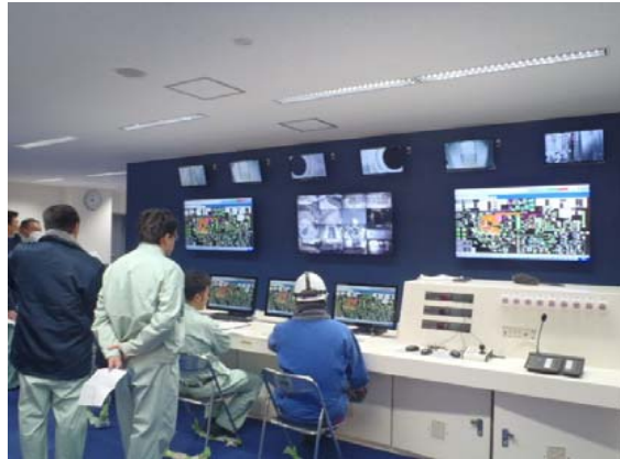
機器の連動確認を行っております。