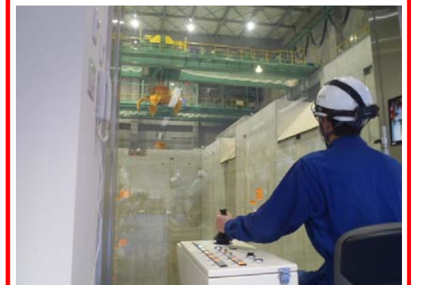
クレーンの動作確認を行っております。