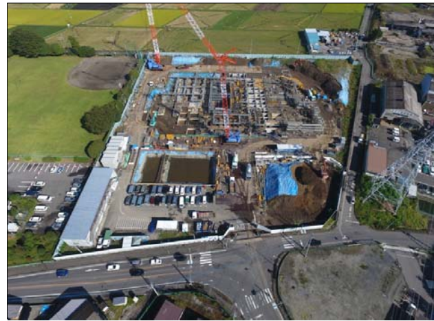
航空写真(建設地全体)