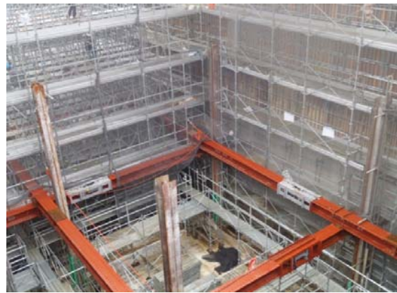
ごみピット(ごみ焼却棟)