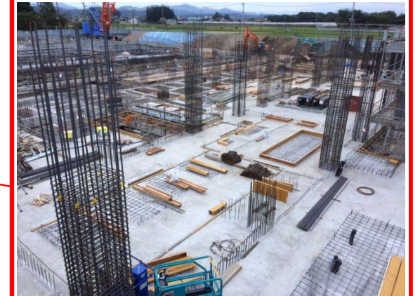
炉室・発電エリア基礎(ごみ焼却棟)