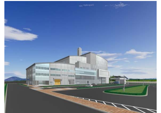
完成イメージ(南西からの見上げ)