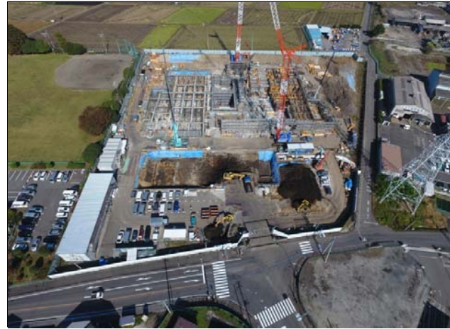
航空写真(建設地全体)