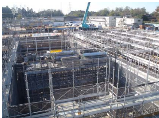
ごみピット(ごみ焼却棟)