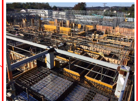
炉室・発電エリア(ごみ焼却棟)