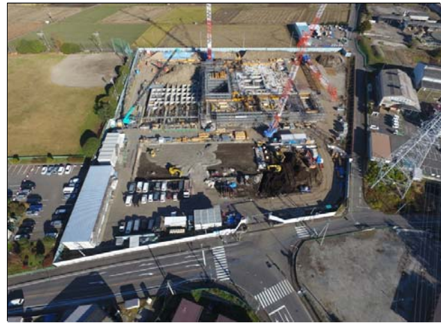
航空写真(建設地全体)