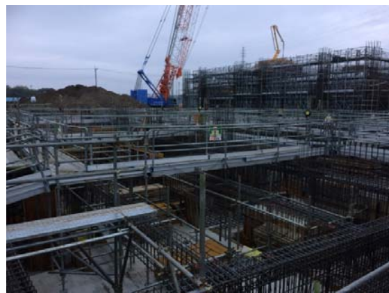
プラットホームエリア(ごみ焼却棟)