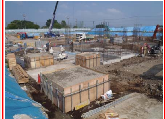
炉室・発電エリア基礎(ごみ焼却棟)

ごみピット底部のコンクリート打設が完了し、ごみピット側壁のコンクリート打設のための準備を行っております。