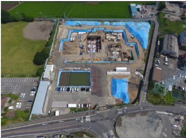
航空写真(建設地全体)