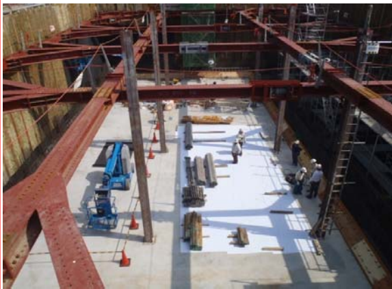
ごみピット(ごみ焼却棟)

ごみピット底部のコンクリート打設が完了し、ごみピット側壁のコンクリート打設のための準備を行っております。