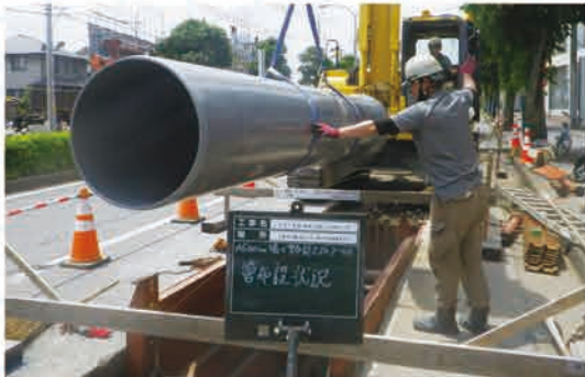
雨水管きよの工事

市内各地の浸水を防止・軽減するために、雨を河川に流す管きよの工事を進めています。