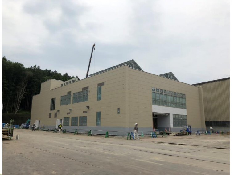
管理棟・浸出水処理施設工事

管理棟の外壁塗装工事が完了しました。屋内では、引き続き、空調設備・換気設備の整備を行っております。