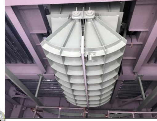
プラント設備工事

被覆施設内部の埋立地では、基盤工事が完了しました。引き続き、浸出水の漏水を防ぐ遮水工工事をしております。