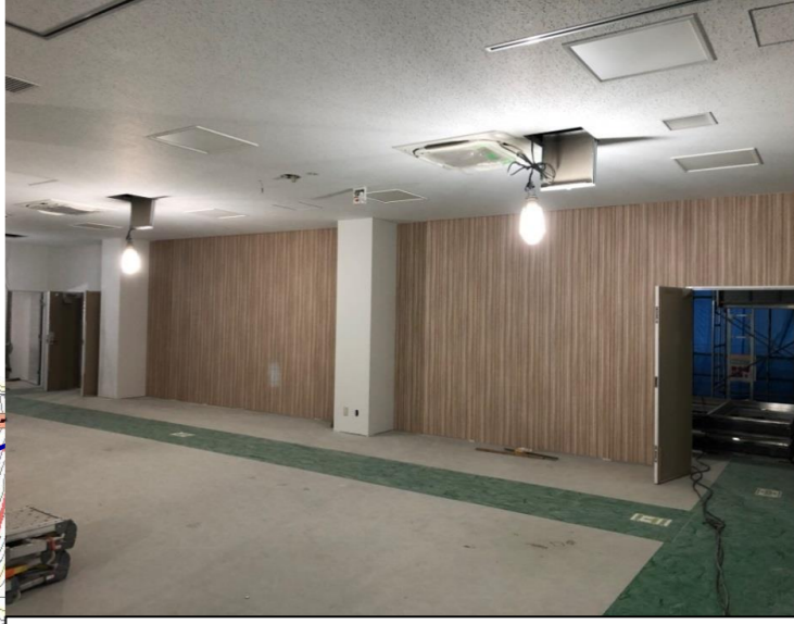
管理棟・浸出水処理施設