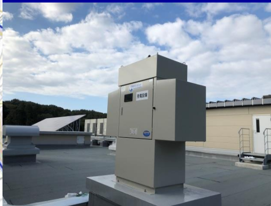
非常用発電設備工事

埋立地内では浸出水の漏水を防ぐ遮水工と、漏水検知システムの整備を行っております。