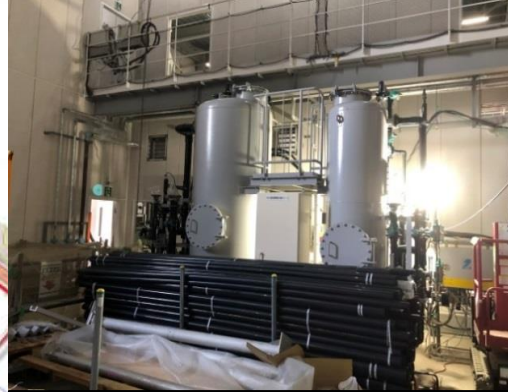
プラント設備工事