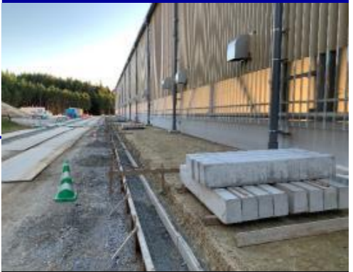
歩行道境界ブロック工事