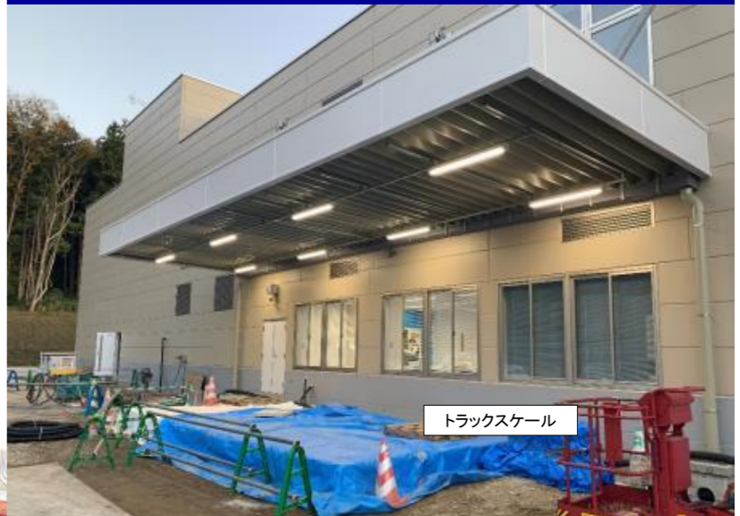
管理棟・浸出水処理施設