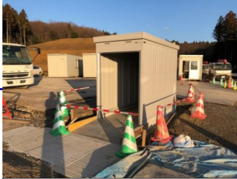
動力消防ポンプ保管庫工事