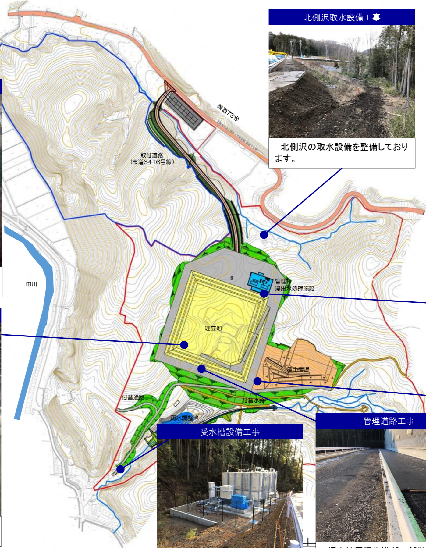
北側沢取水設備工事