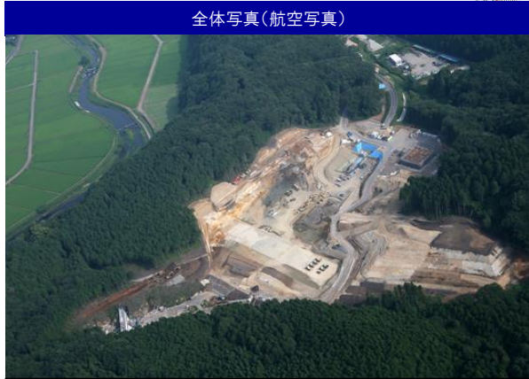
全体写真(航空写真)