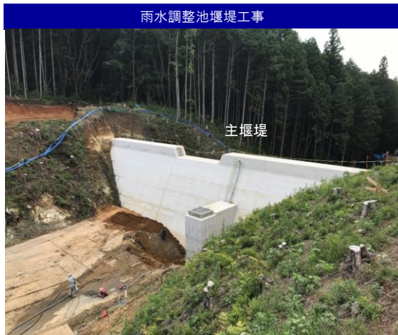
雨水調整池堰堤工事