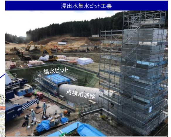
浸出水集水ピット工事

埋立地最深部の集水ピットへ続く点検用通路(アーチカルバート)の施工を行っております。