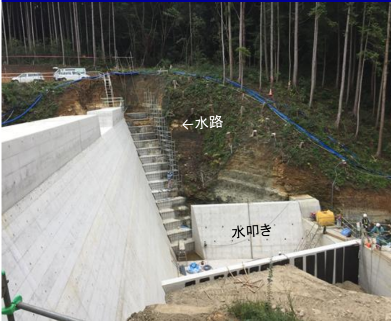
雨水調整池堰堤工事

埋立地の底面まで掘削が進みました。現場で発生した岩を盛土として利用するため破碎処理を行っております。