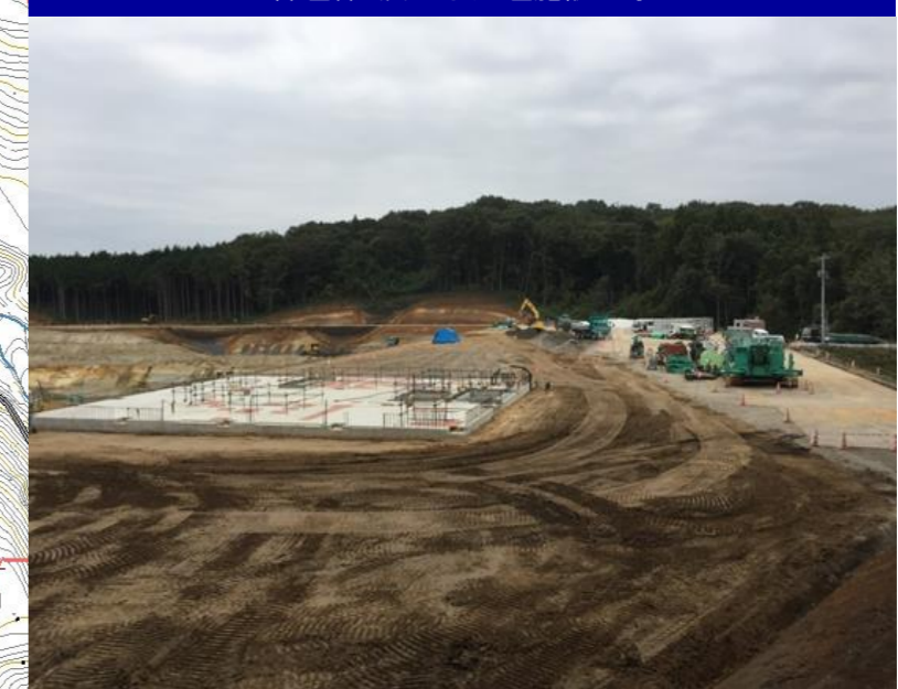
管理棟・浸出水処理施設工事