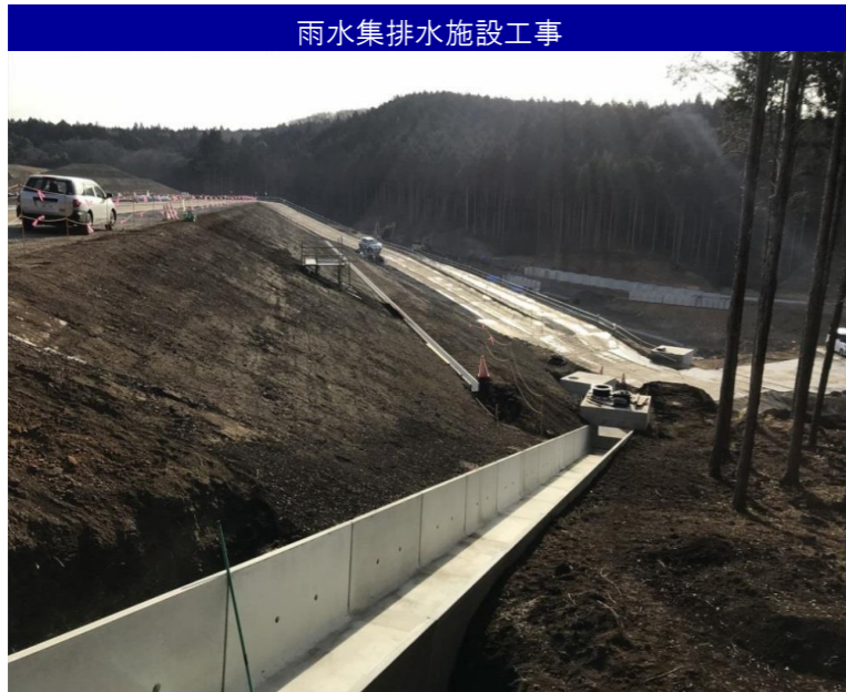
雨水集排水施設工事

被覆施設の材料が、埋立地内に搬入されていることが確認できます。また、管理棟の建屋も確認できます。