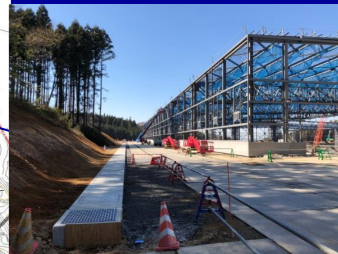
雨水集排水施設工事

敷地東側の雨水側溝が完了しました。現在、敷地西側の雨水側溝の整備を行っております。