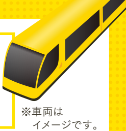
※車両はイメージです。

「MOVE NEXT」とはLRTを軸に市全体の交通ネットワークを充実させる取組を表すメッセージ。クルマだけに頼ることなく、子どもから高齢者までみんなが便利にスムーズに移動できるまちをつくることで、人の流れを活性化し、まちの賑わいを高め、活気ある宇都宮を創ります。