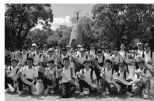
▲平成29年度の平和親善大使25人。原爆の子の像の前で「千羽鶴に平和の祈りを込めて」。本市では、平和の大切さを理解してもらうため、毎年市内の中学生を広島に派遣しています。

前10時～正午▽会場 男女共同参画推進センター「アコール」(明保野町)▽内容 平和を願う鶴折り。折り紙は会場に用意してあります。作った折り鶴は、平和親善大使(右記参照)によって、広島平和記念資料館館長に引き渡されます。