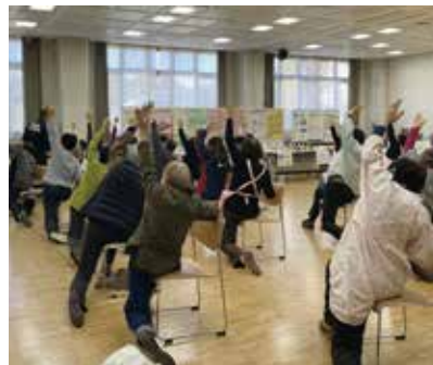
▲ひざ痛・腰痛予防ストレッチ