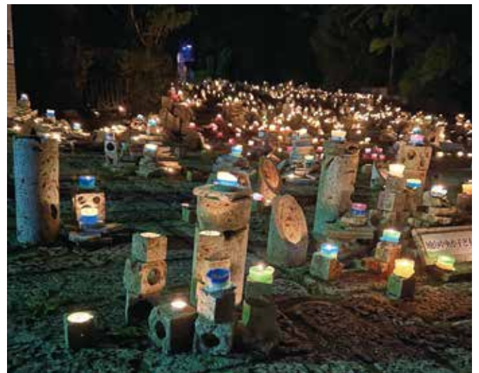
▲幻想的な灯りが広がります