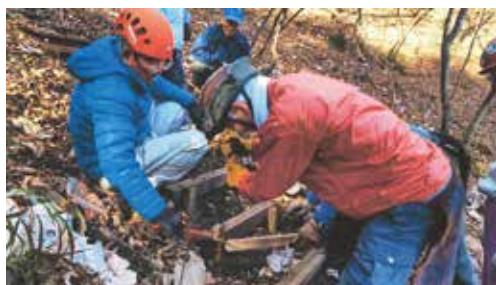
▲木製階段の補修作業