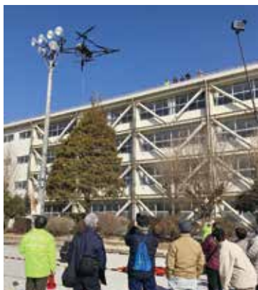
▲災害用ドローンデモンストレーション