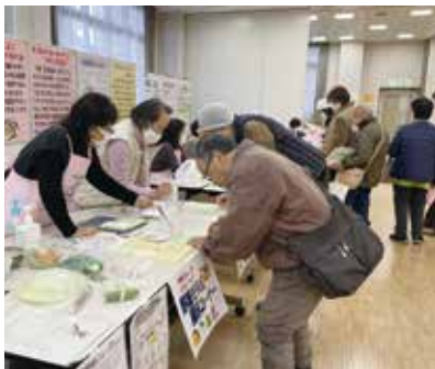
▲野菜350gはどのくらい・？

城山地区は、宇都宮市の39地区の中で「生活習慣健康度」が37位という結果で、特に血糖は38位、血圧・脂質ともに36位という健康課題があります。低栄養を予防し、生活習慣病（糖尿病や脳血管疾患）予防のため、糖分・塩分の取りすぎに注意しましょう。