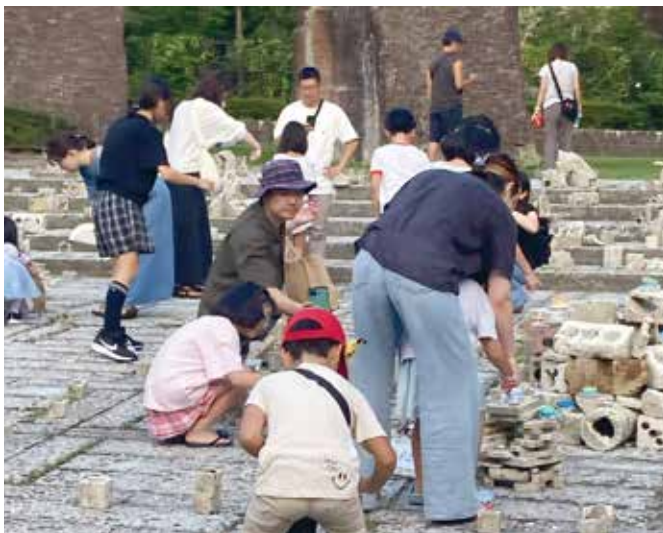
▲17時からキャンドル点灯