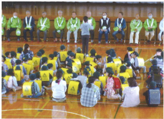
「いつもありがとうございます」

峰小児童の安全を見守る防犯会をはじめとする地域の方々、児童との顔合わせの会がありました。