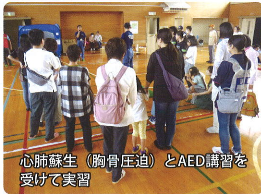
心肺蘇生(胸骨圧迫)とAED講習を受けて実習