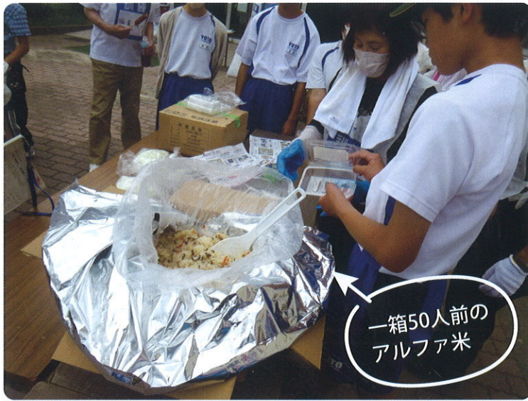
一箱50人前の アルファ米

峰小学校体育館または車中泊による訓練は初の試みです。 宿泊訓練25名を含む参加者約100名が、防災士と救命救急士の講習を受けたのち、自らが考えて行動する実践的な訓練を行いました。 設営から炊き出しまで、お互いに協力し合い、地域や中学生ボランティアの助けを受けながら進められ充実した訓練となりました。