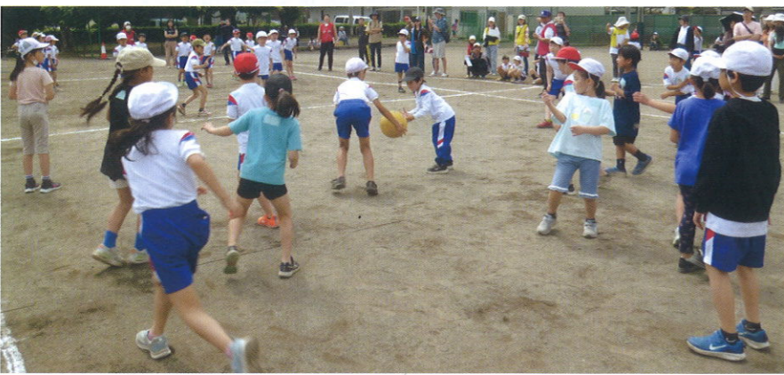
球技大会 5月26日(日)峰小校庭

各自治会子ども会から、約200名が参加し、低・高学年に分けてドッジボールで戦いました。気持ちの良い空に子どもの歓声と皆の声援が響きました。