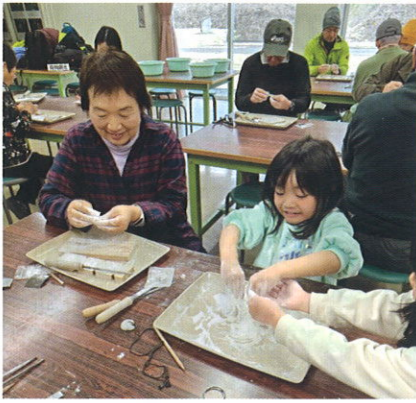
とびやま歴史体験館で匂玉づくり