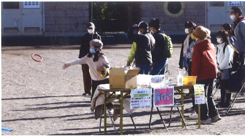
高齢者も子どもたちも笑顔の輪投げ