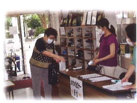
受付での検温・アルコール消毒・記帳