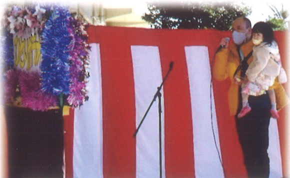
子どもを抱っこして楽しんでるお父さん

自主的実行として連合自治会組織・交通防犯部・環境リサイクル部・老人連絡協議会・健康づくり推進委員会・青少年育成会・子ども会の役員の方々の協力と小・中学校の支援のもとに開催されましたことに感謝いたします。