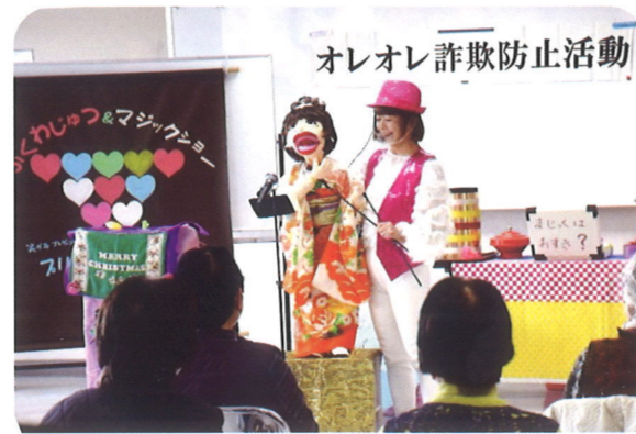
オレオレ詐欺防止活動