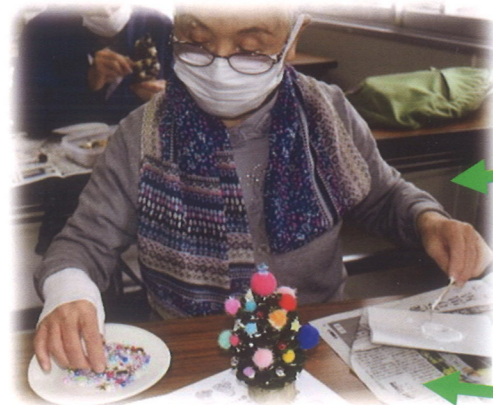
クリスマスツリー作り