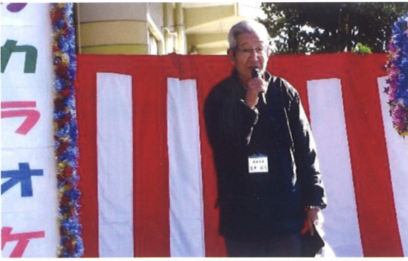
安心・安全な泉が丘のまちづくりに取り組んでいます