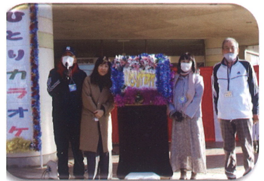
カラオケ担当スタッフ

自主的実行として連合自治会組織・交通防犯部・環境リサイクル部・老人連絡協議会・健康づくり推進委員会・青少年育成会・子ども会の役員の方々の協力と小・中学校の支援のもとに開催されましたことに感謝いたします。