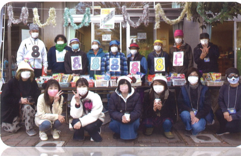
参加証ホルダーの見守り…シールマンエイトの皆さん