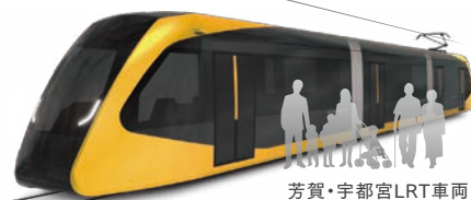
芳賀・宇都宮LRT車両

100年先も安心して便利に暮らせるまちを目指して整備を進めているLRT事業。芳賀・宇都宮の恵みの象徴である「雷の稲光」をモチーフに、「雷」や「雷を受け豊かに実った稲」をイメージさせる黄色がシンボルカラーの「雷都」にぴったりな車両が、2022年、JR宇都宮駅東口-芳賀・高根沢工業団地間を走り出します。街が変わる、毎日が変わる。LRTからはじめる、次の暮らしにどうぞご期待ください。