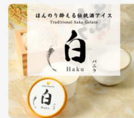
sweets 酔える伝統酒アイス