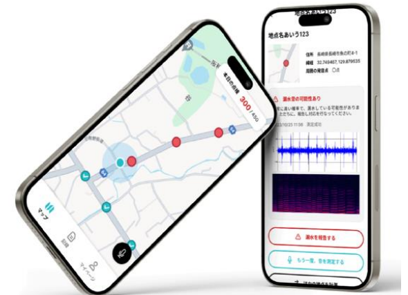
<漏水検知ツールと収集したデータの可視化イメージ>