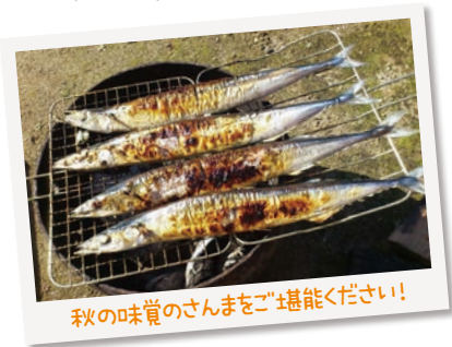
秋の味覚のさんまをご堪能ください!

▽日時 11月23日(金・祝)午前11時30分〜。 ▽会場 青少年活動センター(今泉町)。 ▽対象 市内在住の人。 ▽定員 先着100人。 ▽費用 400円(食事代)。 ▽申込 11月6日午後2時から、電話で、青少年活動センター ☎(663)3155へ。