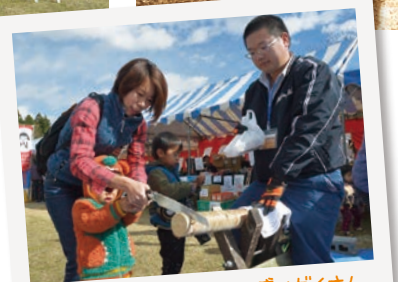
子ども向けのコーナーも盛りだくさん