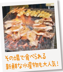
その場で食べられる 新鮮な水産物も大人気!

▽日時 11月10日(土)午前9時〜正午。 ▽会場 中央卸売市場(築瀬町)。 ▽内容 水産物や水産加工品、菓子・乾物などの関連商品、野菜や果物の販売。お楽しみ抽選会。 ▽その他 青果棟は解放しません。駐車場に限りがあるため、来場の際は相乗りなどご協力ください。また、休市日(11月3・4・7・11・14・18・23・25日)を除く午前10時〜午後3時(営業は午前中心)に関連棟を開放しています。 ☎中央卸売市場 ☎(637)6041、関連卸商協同組合 ☎(637)6811