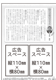
▲教育委員会だより

所13階)に置いてある申込書(市画)からも取り出し可)に必要事項を書き、見積書、広告の原稿、法人の場合は会社概要を添えて、11月22日(必着)までに、直接または郵送(書留または簡易書留)で、〒320-8540市役所教育企画課 ☎(632)2705へ。