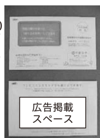
▲納税通知書送付用封筒